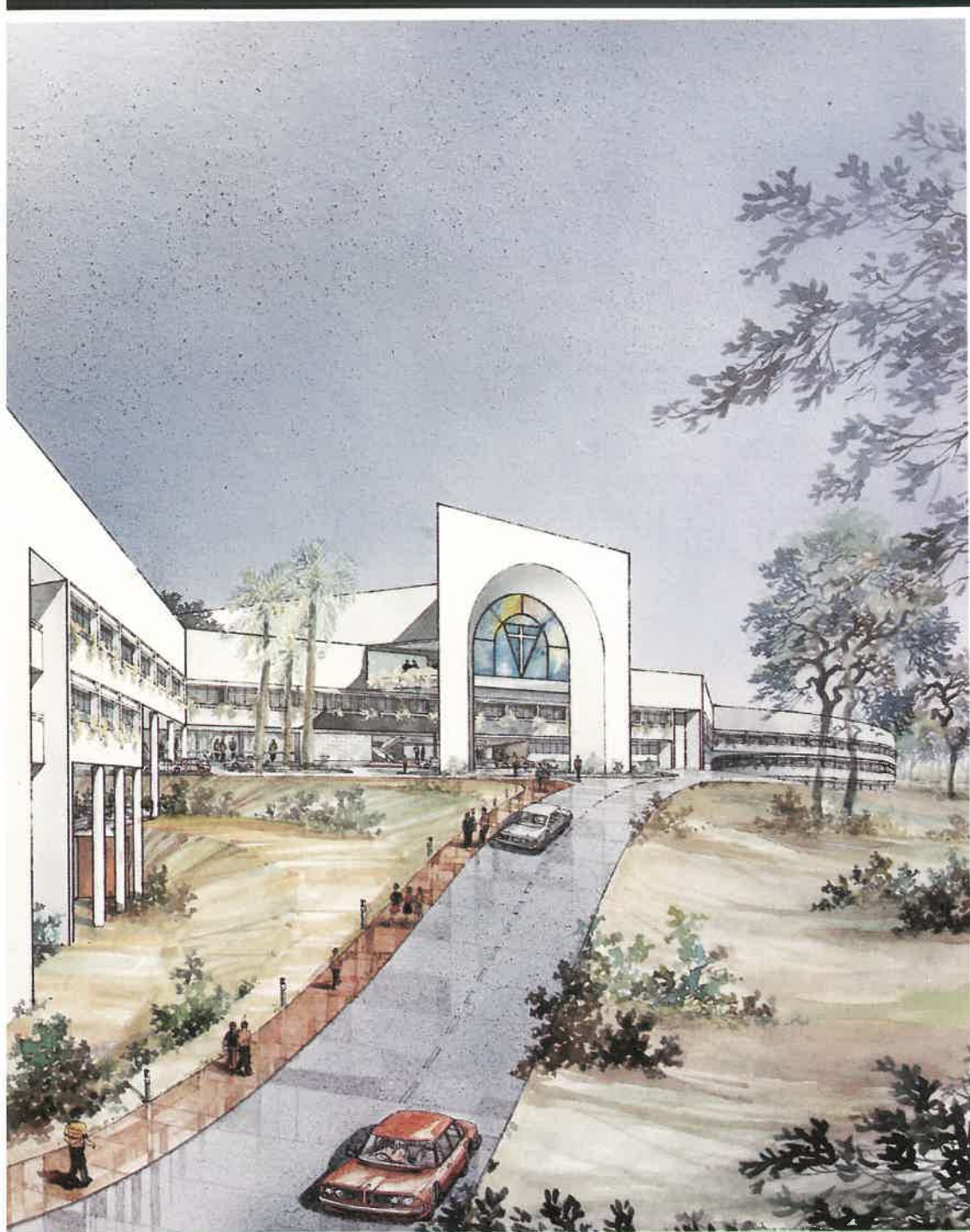
PROPOSED CATHOLIC HIGH SCHOOL